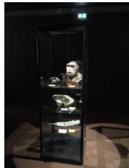
STANY / CHRISTELLE / ELISEÏ